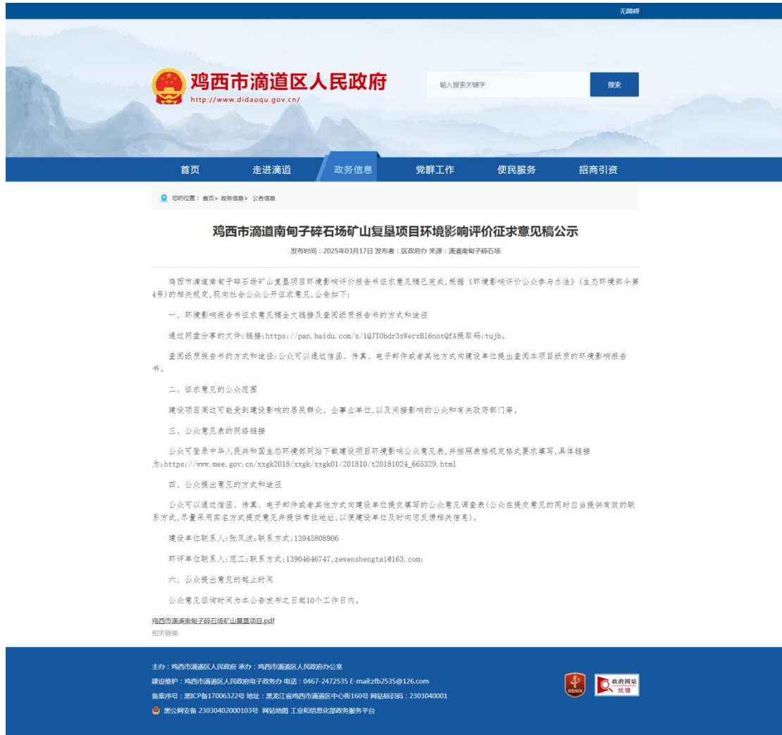
图 3-2-1 征求意见稿网络公示截图