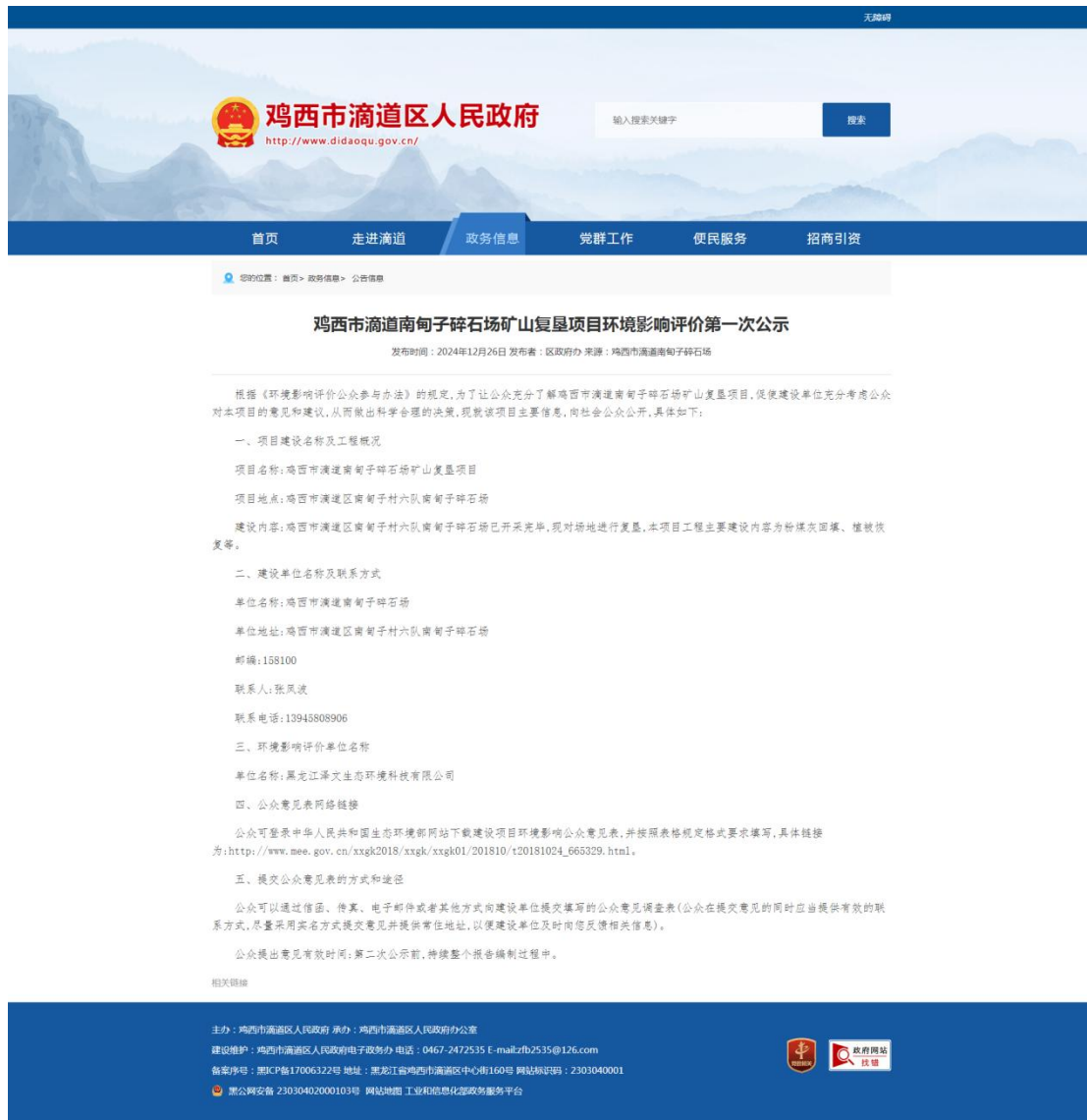
图 2-2-1 第一次网站公示截图

载体：建设单位于 2024 年 12 月 26 日在鸡西市滴道区人民政府网站 ( http://www.didaoqu.gov.cn/ ) 对本项目进行了第一次公示，截图如下：