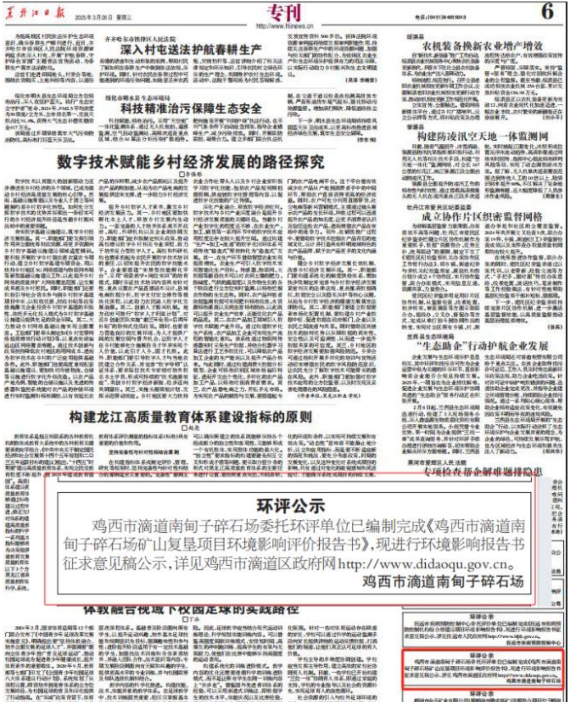
图 3-2-3 第二次报纸信息公示截图